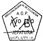
Mg. ROCÍO HAYDE RODRIGUEZ LÓPEZ. DIRECTORA DEL PROGRAMA SECTORIAL III UGEL N° 09 - HUAURA

RHRL/DPSIII LBHE/JAGP DLLF/EEPR CC archivo